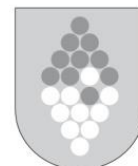
stemma scala di grigi