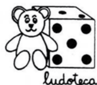
3] Comitato genitori all'opera per la felicità di bambini e genitori

- Martedì dalle 9:30 alle 11:00 - Martedì dalle 16:00 alle 17:30 - Mercoledì dalle 13:30 alle 15:00