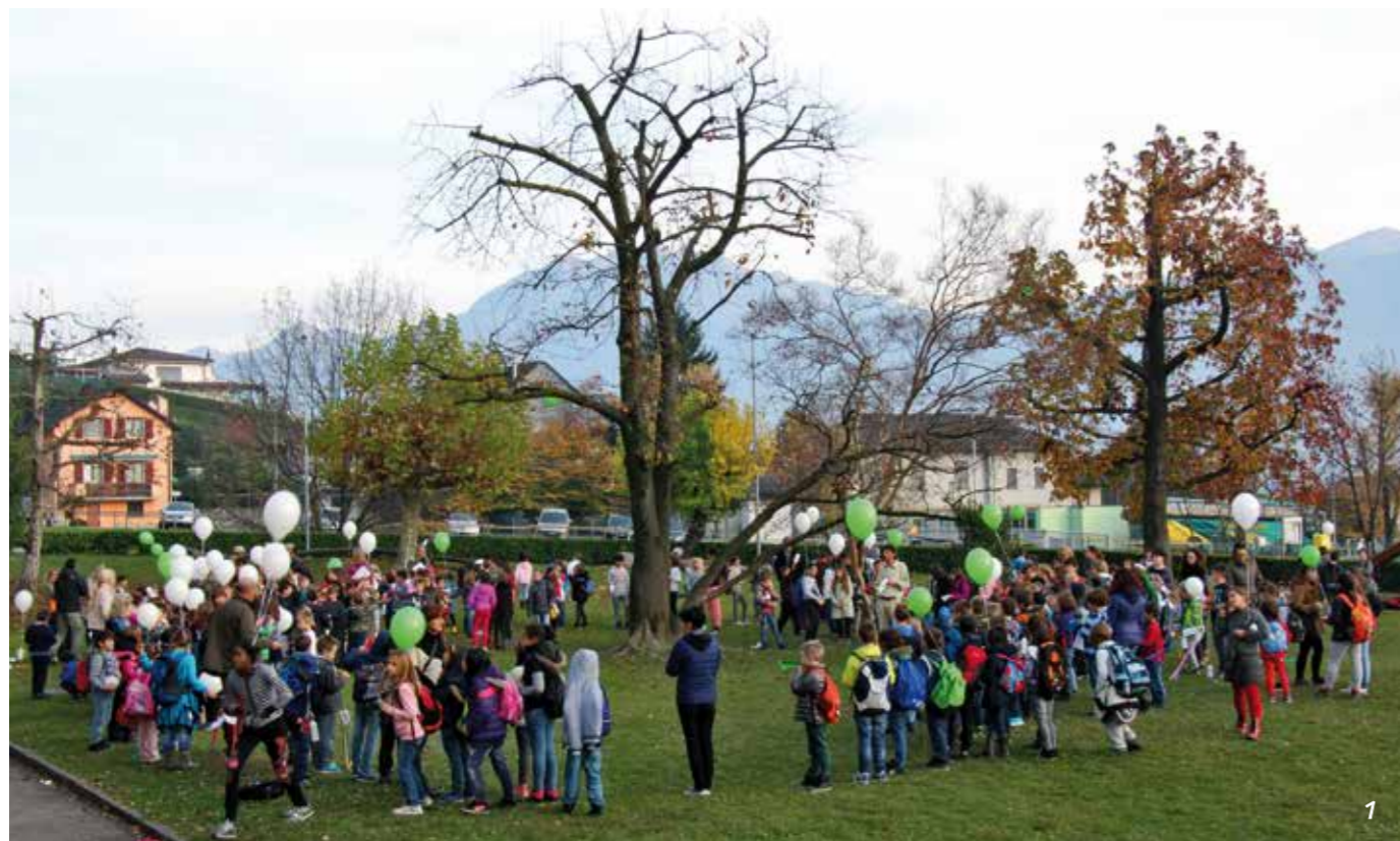
1] I bambini durante la Festa del clima