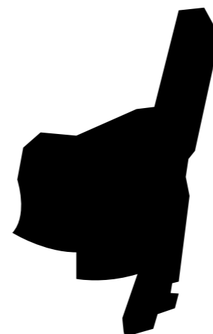
sagoma del territorio

Auguri a tutti per questi 15 anni assieme!