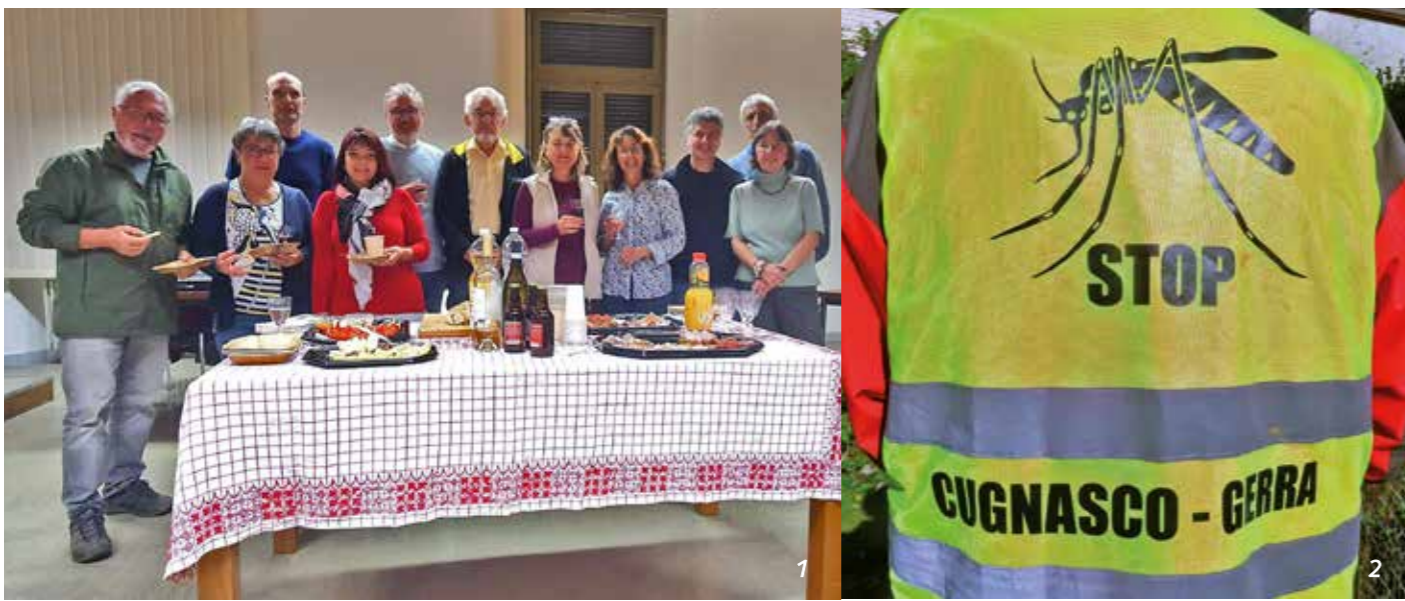
1] Il gruppo di volontari anti-zanzara tigre