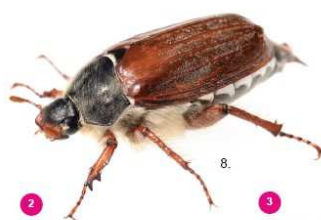
2 Melolontha melolontha Il comune maggiolino, 25-30 mm, non possiede ciuffi bianchi.