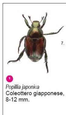
1 Popillia japonica Coleottero giapponese, 8-12 mm.