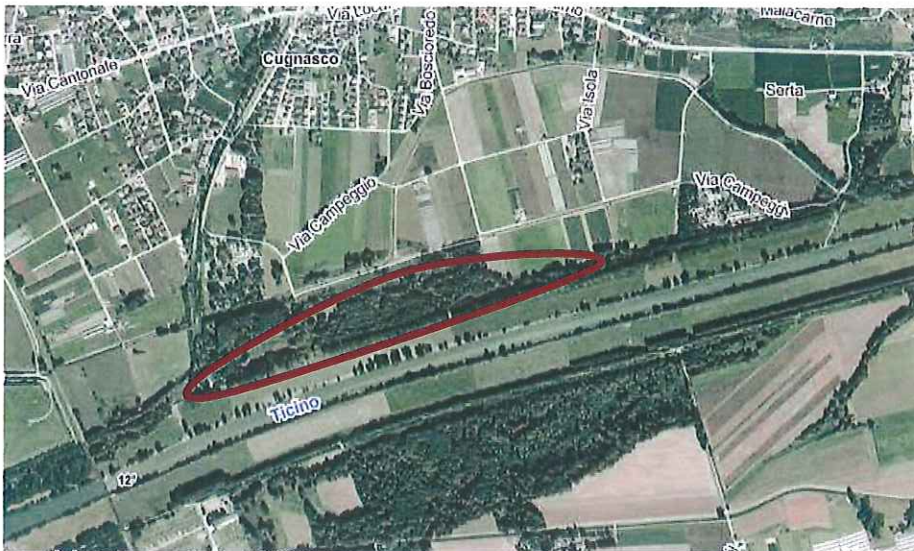
Zona particolarmente adatta nel nostro territorio