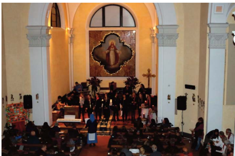
Sabato 16 dicembre 2017, Chiesa di Gerra Piano. Il Piccolo Coro, il Coro Interparrocchiale ed il gruppo Sound of Glory hanno tenuto il Concerto di Natale. Il ricavato di Fr. 1.250,- è andato a Missio per l’infanzia che quest’anno sosteneva la Casa di accoglienza di Santhpur in India.