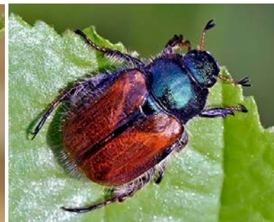
Maggiolino degli orti, Phyllopertha horticola. Esoscheletro più marrone e assenza dei ciuffi bianchi laterali e caudali (lunghezza: 10 mm).

Il coleottero indigeno che assomiglia maggiormente per forma e dimensione a Pj è il giugnino ( Mimela junii ), il cui adulto ha colore simile a Pj e presenta anche delle macchie laterali bianche. Si distingue dal coleottero giapponese in quanto è un po' più grande di Pj (lunghezza 15 mm), non presenta nessuna macchia a livello caudale e le elitre coprono tutto il corpo.