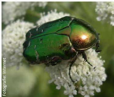
Cetonia dorata, Cetonia aurata. Esoscheletro più verde e assenza dei ciuffi bianchi laterali e caudali (lunghezza: 18 mm).