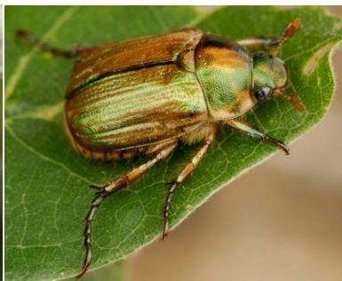
Anomala vitis. Esoscheletro senza ciuffi bianchi laterali e caudali (lunghezza: 15 mm).