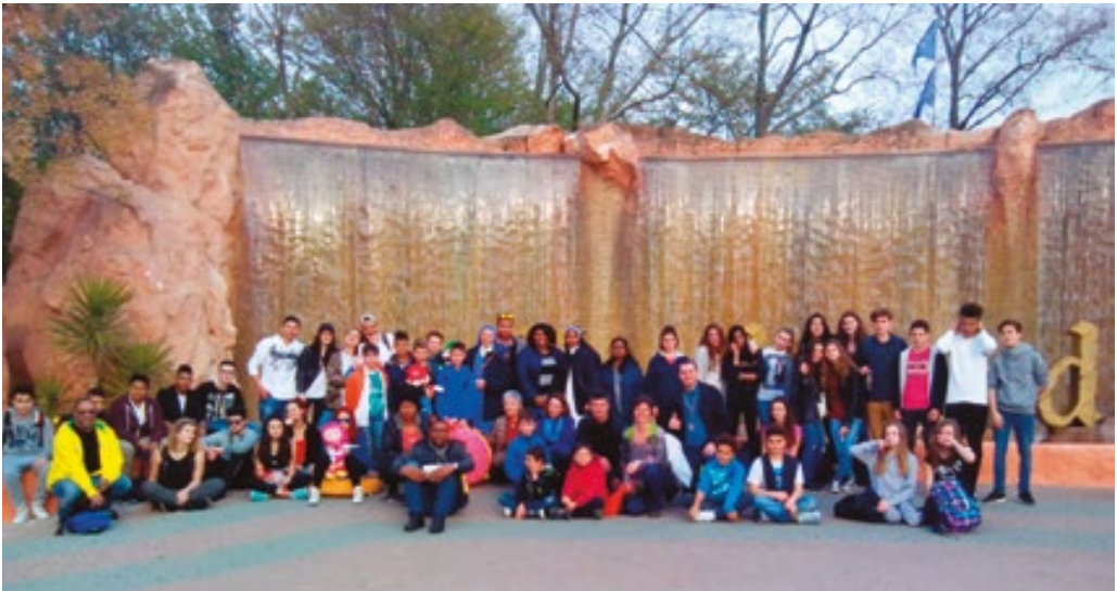
Gardaland, giovedì 31 marzo 2016